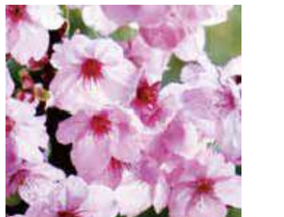
陽光(ヨウコウ) アマギヨシノとカンヒザクラを交配して作った品種。花茎は約4.5cmで花色は淡紅紫色。