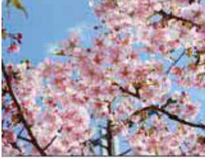
河津桜(かわづざくら) オオシマザクラ系とカンヒザクラ系の自然交配種と推測される。花はピンクの強い一重。

染井吉野(そめいよしの) エドヒガンとオオシマザクラの雑種で、江戸末期に江戸染井村(現在の東京都豊島区)の植木屋が、“吉野桜”の名前で売り出したと言われる。居ながらにして吉野山のサクラが楽しめると瞬間に人気を得て、東京を中心に広く日本中に植えられた。春には圧巻なサクラの景色を楽しませてくれる。