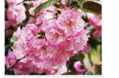
関山(かんざん) 大輪で濃紅紫色の花は塩漬けにして桜湯やあんぱんのへそに使う。