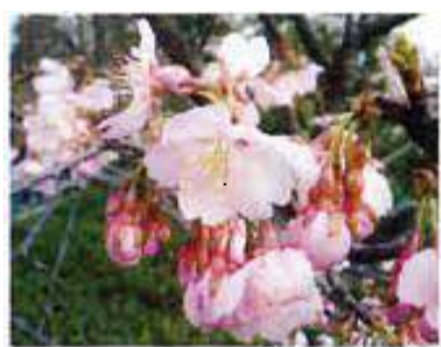
大寒桜(おおかんざくら) カンヒザクラとオオシマザクラの雑種で、お花見の直前に咲く。