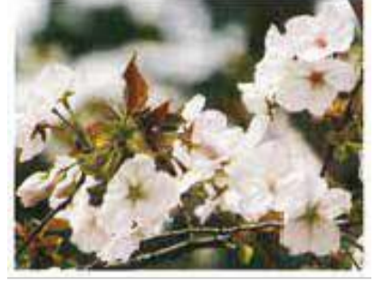
太白(たいはく) 大輪で一重咲きの花が見事。