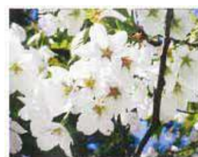
大島桜(オオシマザクラ) 葉は塩漬けにするとサクラ特有の香りがする。桜餅などに使われる。