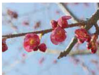
寒緋桜(かんひざくら) 中国南部や台湾に分布する桜。花柄は下垂し花茎2cmばかりの半開状の暗紅紫色あるいは桃紅色。