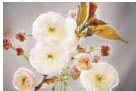
楊貴妃(ようきひ) 中国の代表的な美人楊貴妃を連想して名づけられた。花は淡紅色で先のほうが濃い。