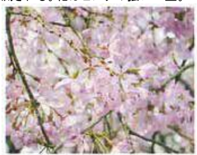
紅枝垂(べにしだれ) 花の紅色が濃く、優美に咲く様子が好まれる。寿命が長く大木になる。