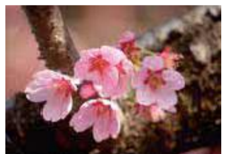
雅(みやび) 皇太子妃雅子様にあやかり、埼玉県鳩ヶ谷市の生産者が当初プリンセス雅として売り出した。

染井吉野(そめいよしの) エドヒガンとオオシマザクラの雑種で、江戸末期に江戸染井村(現在の東京都豊島区)の植木屋が、“吉野桜”の名前で売り出したと言われる。居ながらにして吉野山のサクラが楽しめると瞬間に人気を得て、東京を中心に広く日本中に植えられた。春には圧巻なサクラの景色を楽しませてくれる。