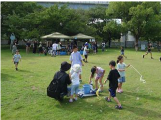
水遊びワークショップ