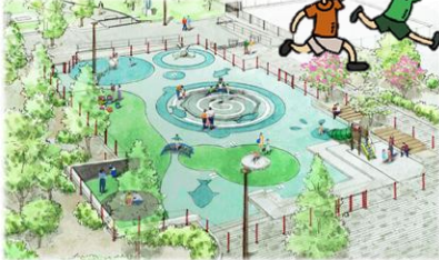
インクルーシブ遊具