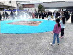
ポップアップ噴水