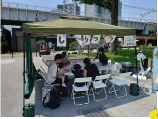
草花ワークショップ