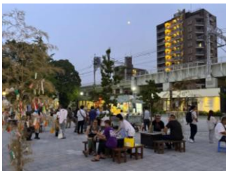
占用による利用状況