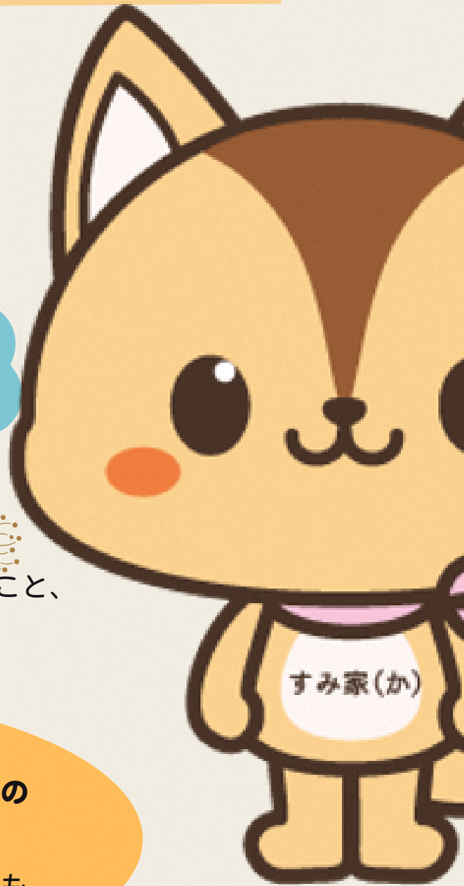
オリジナルイメージキャラクター シマリスの「しまりん」