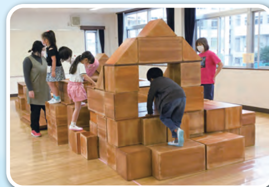
「みんなのお家が完成!」