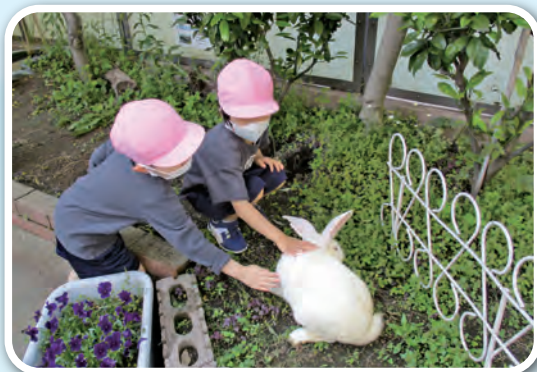
「うさぎさん、かわいいね」

自然に触れて感動する体験を通して、好奇心や探究心、命を大切にする気持ちを育みます。