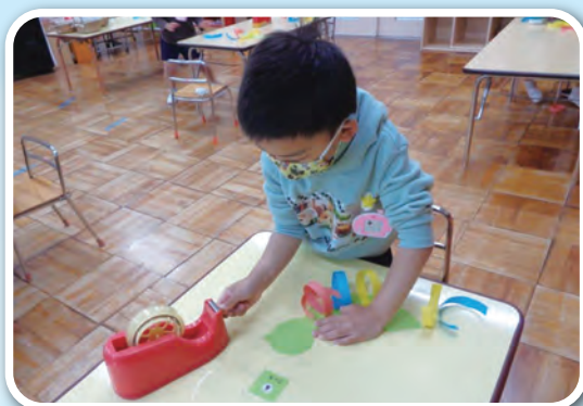
「すてきな鳥をつくろう」