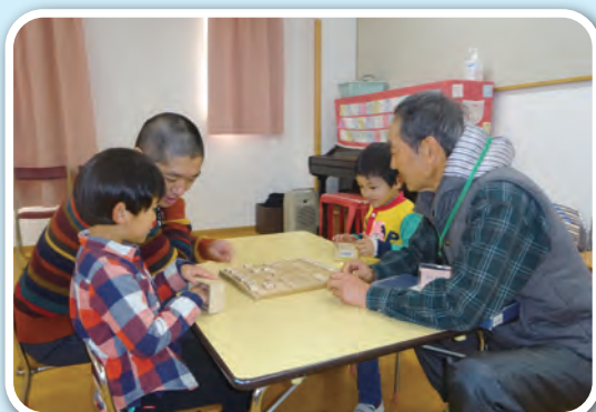
ふれあい会「おじいちゃんと勝負!」