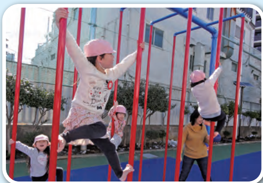
「絶対ゴールするぞ!」