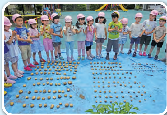
ジャガイモ収穫「すごい! 240個!!」