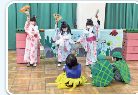
「私たちの踊り、すてきでしょ」