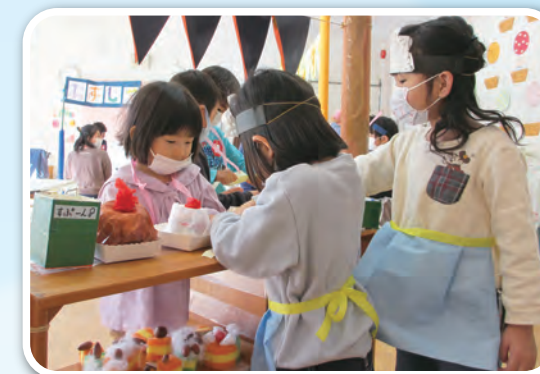
「次は誰がお店の人になる?」