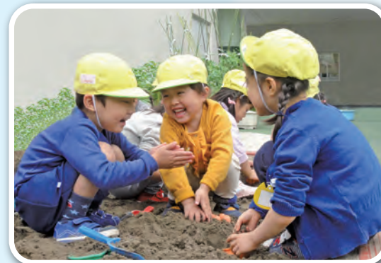
「楽しいね」「面白いね」