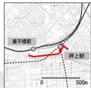
特別区道墨127号路線

墨田区景観基本計画において景観構造として位置づけている荒川、北十間川や曳舟川通り、隅田公園などについては、景観形成上重要なものであるため、景観重要公共施設への指定に向けて今後検討していきます。