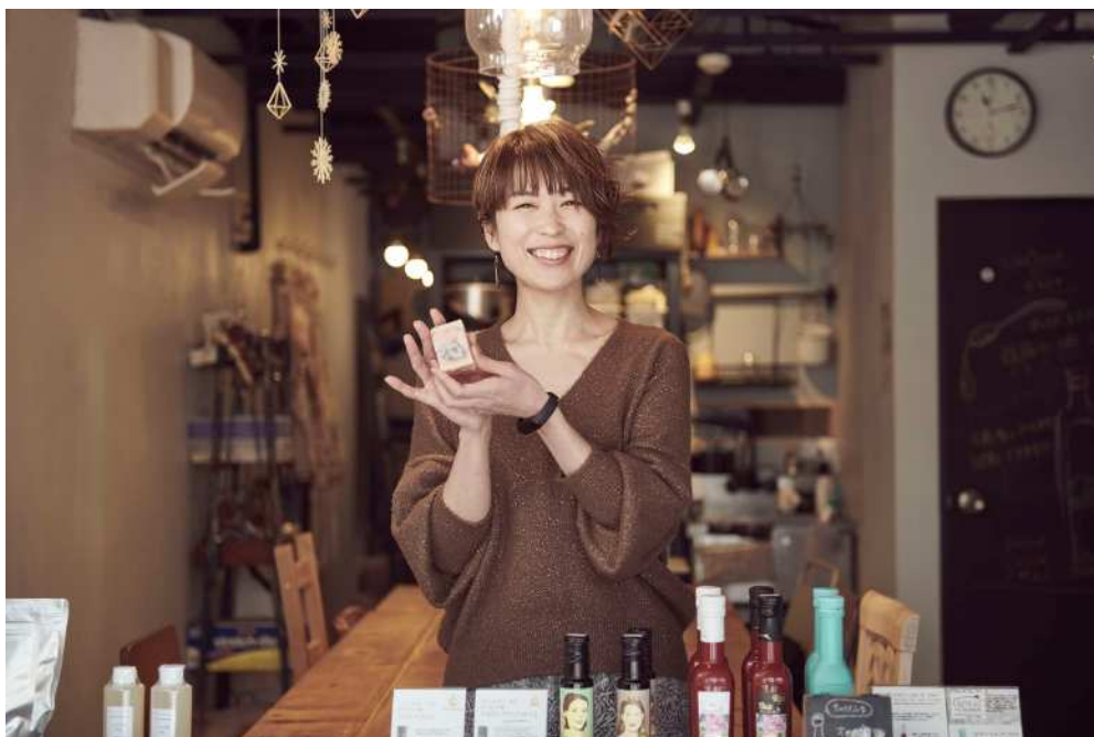
あめおさん / Ciao soap

手作り石けん教室の運営などをされている Ciao soap さん。墨田区を起業の地にした理由から役所のサポートまで下町ならではのエピソードを伺いました。