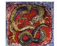
絵画クラスで描いた北斎画 (5歳児クラス)