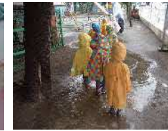
雨の日の散歩 ♪かたつむり見つかるかな♪