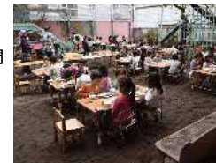
さんまパーティ 一人一匹 骨をとりながら「おいしいね」