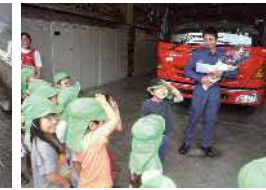
子どもの日花の日礼拝後 消防署訪問