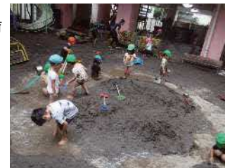
園庭での楽しいどろんこあそび