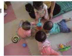
分園0歳児「あ・そ・び」