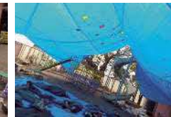
年長お泊まり保育 友だちや保育者と一緒にいろいろな 経験をして過ごします