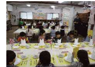
年長組 もうすぐ1年生!! お別れお食事会