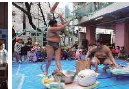
おすもうさんと一緒に もちつき大会