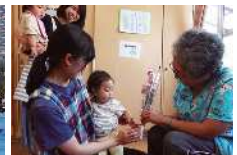
花の日(嘱託医にお花をお届け)