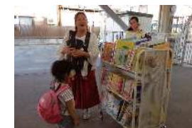
絵本貸し出し文庫