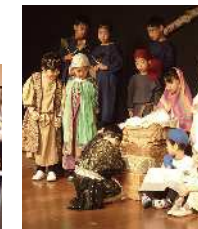
クリスマスページェント