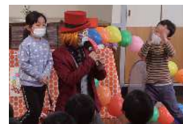
父母の会主催知育手品ショー