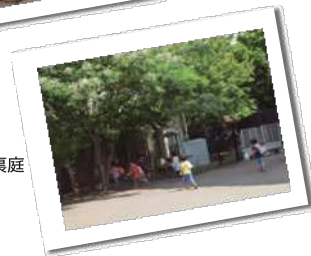
電車が見える裏庭