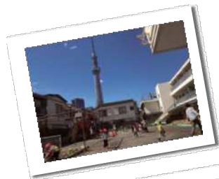
園庭から見るスカイツリー

興望館は、1919(大正8)年にキリスト教精神に基づき「セツルメント」として墨田で事業を始め、その時代に適した事業を続け現在に至っています。興望館は、子どもの育成を中心とし、多様な福祉活動を通じて、乳幼児から高齢者まで幅広い世代が集うコミュニティを目指しています。