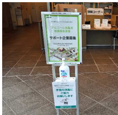
広告付き手指消毒剤・消毒液スタンド