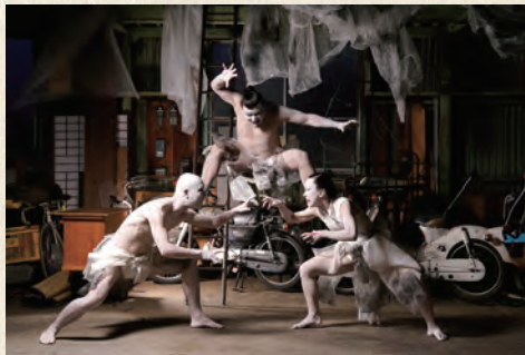
舞踏公演「天水」

【問合せ】「隅田川 森羅万象 墨に夢」実行委員会事務局 ☎5608-5446 ＊受け付けは月曜日～金曜日の午前9時半～午後4時半(祝休日を除く)