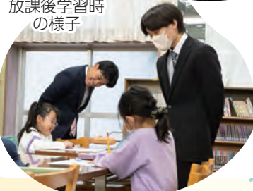
放課後学習時 の様子

区立小・中学校での放課後学習等の支援を行う「すみだスクールサポートティーチャー」を募集しています(謝礼あり)。詳細は区HPをご覧ください。