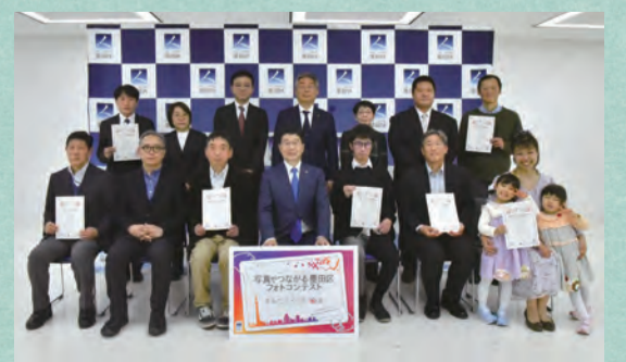
フォトコンテストの受賞者・協賛事業者の皆さんと

リニューアルオープンを迎えたほか、隅田公園や錦糸公園ではさくら祭りも開催しており、連日多くの方が墨田区を訪れています。皆さんも“すみだらしい春”を探しに出掛けてみてはいかがでしょうか?