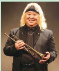
エリック・ミヤシロ

オーケストラ meets オーケストラ!ジャズ、クラシックを越えた音楽の冒険 Blue Note Tokyo "NJP" Symphonic Jazz Orchestra directed by Eric Miyashiro[Borderless Music Adventure] 【とき】7月11日(土)午後5時開演【内容】▶第1部=ブルーノート東京オールスター・ジャズ・オーケストラの演奏 ▶第2部=新日本フィルハーモニー交響楽団との共演【出演】エリック・ミヤシロ(指揮・トランペット)ほか【入場料(全席指定)】▶S席=6500円 ▶A席=5500円 *区内在住在勤の方は5200円、区内在住在学の小学生~高校生、大学生等は1000円